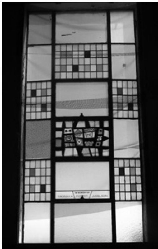
2 - Kingsway Jewish Center, Brooklyn, 1955.

When building resumed after the Second World War, modernist building forms stimulated a gradual change in glass designs toward less literally representational ones. As various levels of abstraction in painting and sculpture gained international eminence, congregations more often permitted expressive alterations of human shapes, bursts of colour perhaps including a recognizable figure or face, evocations of leaves or other natural forms such as are seen at the edges of Figure 1, symbols or pictographs (fig. 2) or designs with no representation at all (fig. 3). By the 1950s, some glass designers simplified human forms by making them more geometric at a time when Cubist abstraction still signified modernity to most viewers. Other designs distorted figures by elongation that also suited tall and narrow windows. In the later 1960s and 1970s, designers introduced curvilinear shapes in bright colours, while elsewhere, bold black outlines gave force to wraithlike translucent shapes; these tendencies were fostered by designers' exposure to Expressionist art, which, with Cubism, became familiar from galleries and periodicals, art schools and expanding university art history