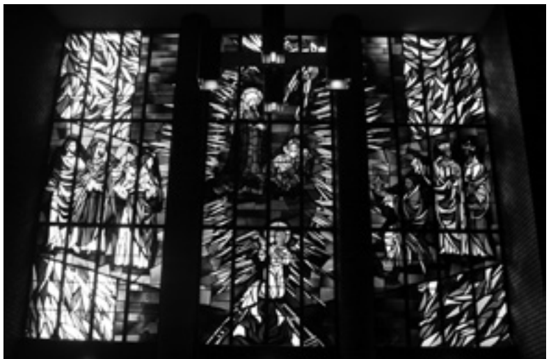
1 - Roman Catholic Church of the Epiphany, New York City, 1965-67.

De diversiteit van het Amerikaanse religieuze leven verklaart een groot deel van de