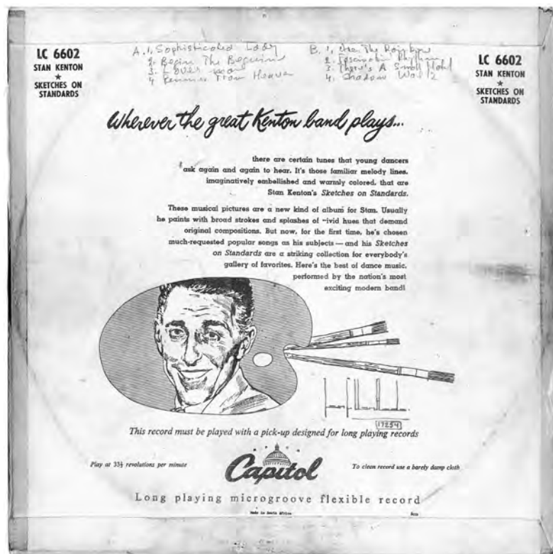
3. Achterkant 10 inch lp Stan Kenton, Sketches On Standards .