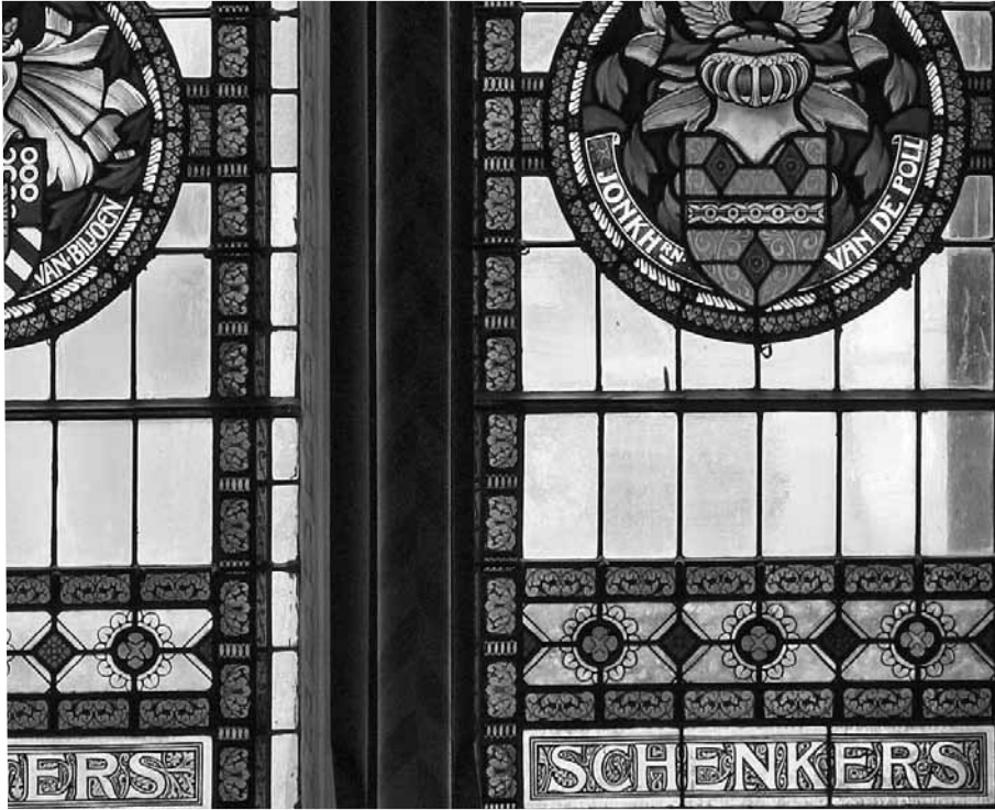
Afb. 2. Anoniem, Detail Stichters- en schenkersramen van het Rijksmuseum Amsterdam , geplaatst in 1905, glas-in-lood, ca. 4 x 1 meter, Rijksmuseum Amsterdam.

snelgroeïende burgerij die verantwoordelijk was voor de opleving van de kunst en de wetenschap. Het is geen toeval dat talloze musea en andere culturele instellingen uit deze periode stammen, denk bijvoorbeeld aan het Concertgebouw (1888), de Stadsschouwburg (1894) en het Stedelijk Museum (1895). Net als op andere maatschappelijke terreinen (zorg, onderwijs, huisvesting) waren het particulieren die het initiatief namen en vervolgens probeerden de overheid te bewegen deel te nemen aan de financiering. De infrastructuur van de kunstsector, die rond 1900 voornamelijk door particulieren tot stand werd gebracht, vormt nog altijd de grondslag van ons bestel.