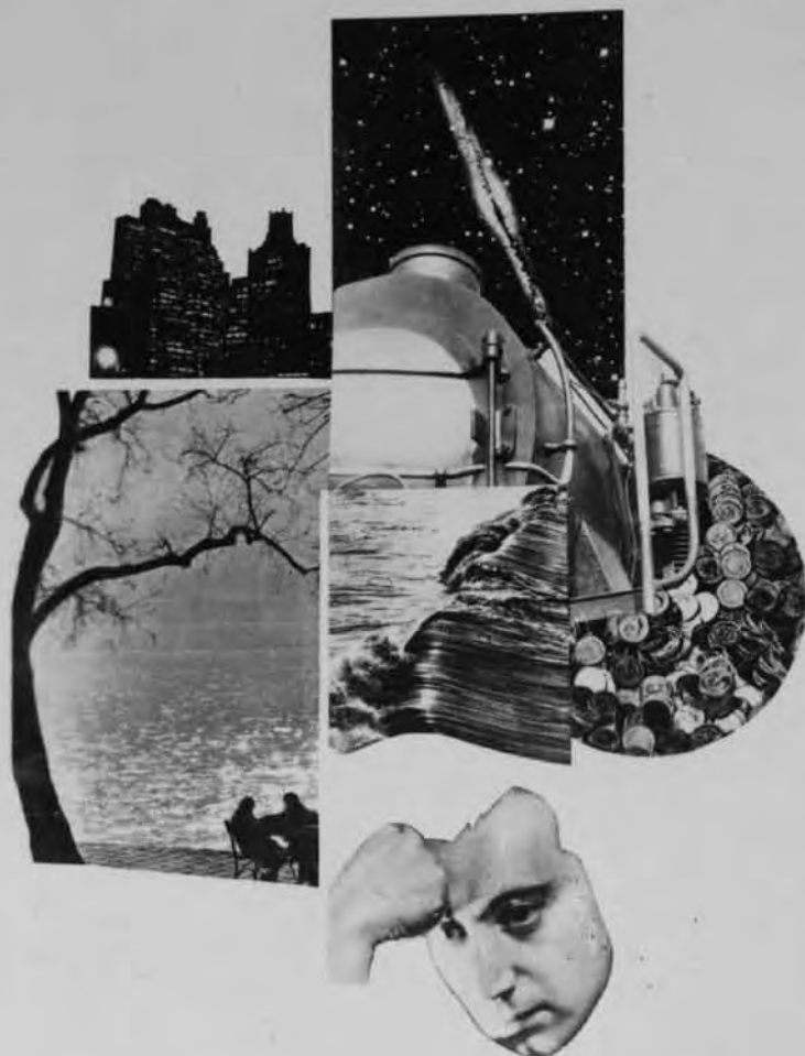
5, Eugène Brands, Denker, s.a. , reproductie van een fotomontage, ca. 17 x 10 cm, in: Reproducties van mijn werk , 1938, uit de privécollectie van Eugénie Brands.