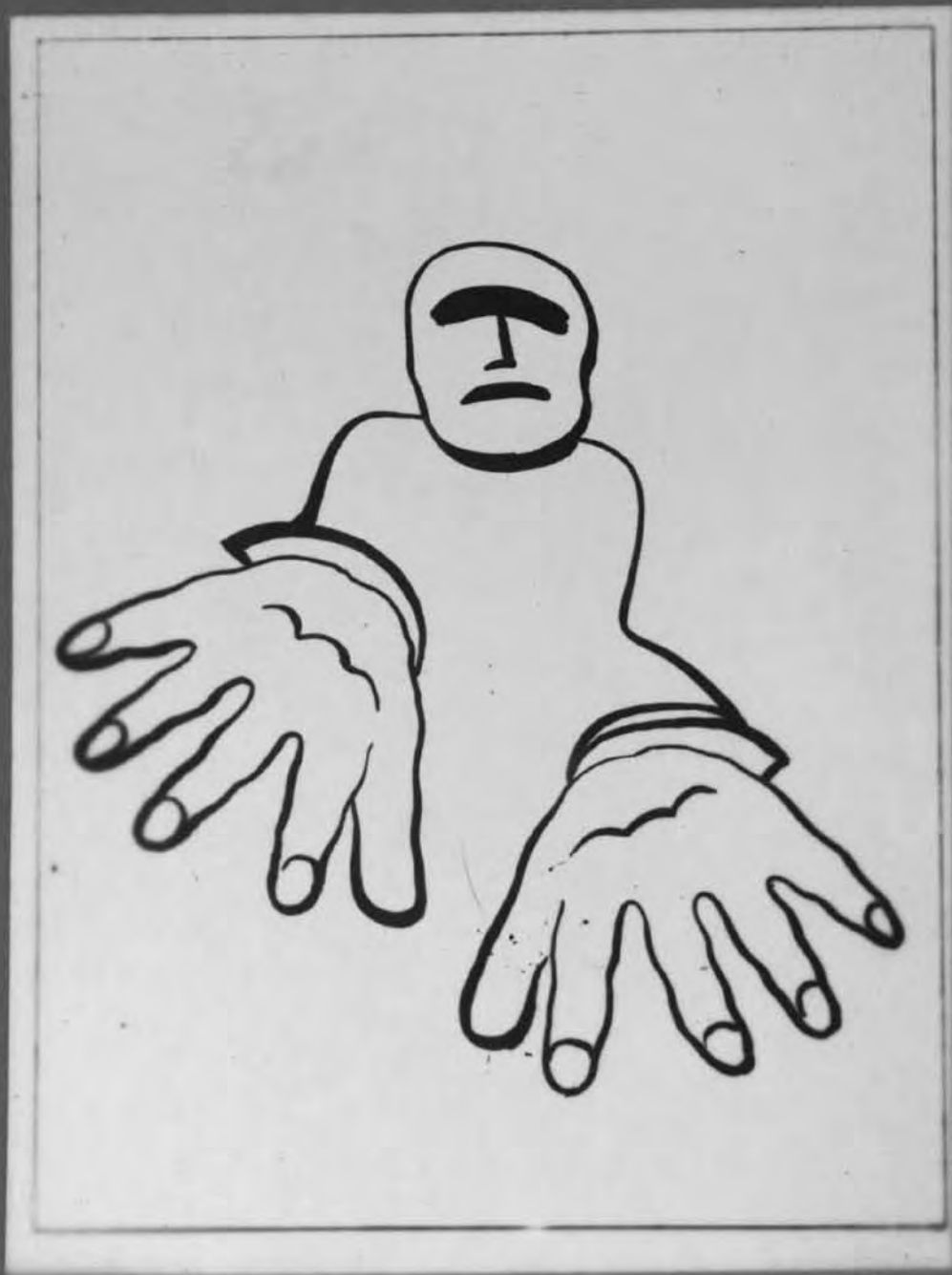
7. Eugène Brands, Blinde man, s.a. , reproductie van een penseeltekening, ca. 17 x 10 cm, in: Reproducties van mijn werk , 1938, uit de privécollectie van Eugénie Brands.