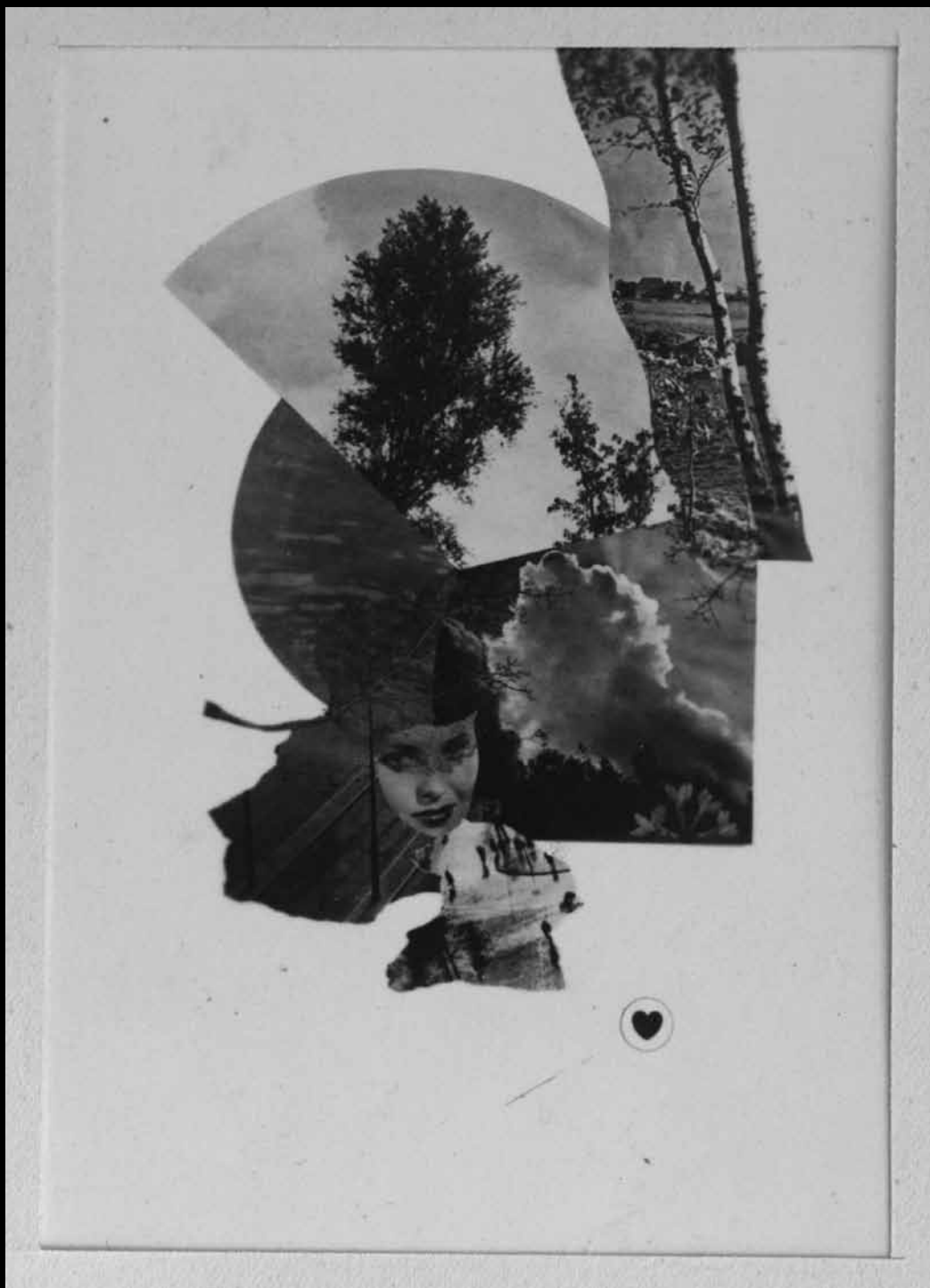
4, Eugène Brands, Het werkelijke is juist het wonderlijke (1937), reproductie van een fotomontage, ca. 17 x 10 cm, in: Reproducties van mijn werk , 1938, uit de privécollectie van Eugénie Brands.