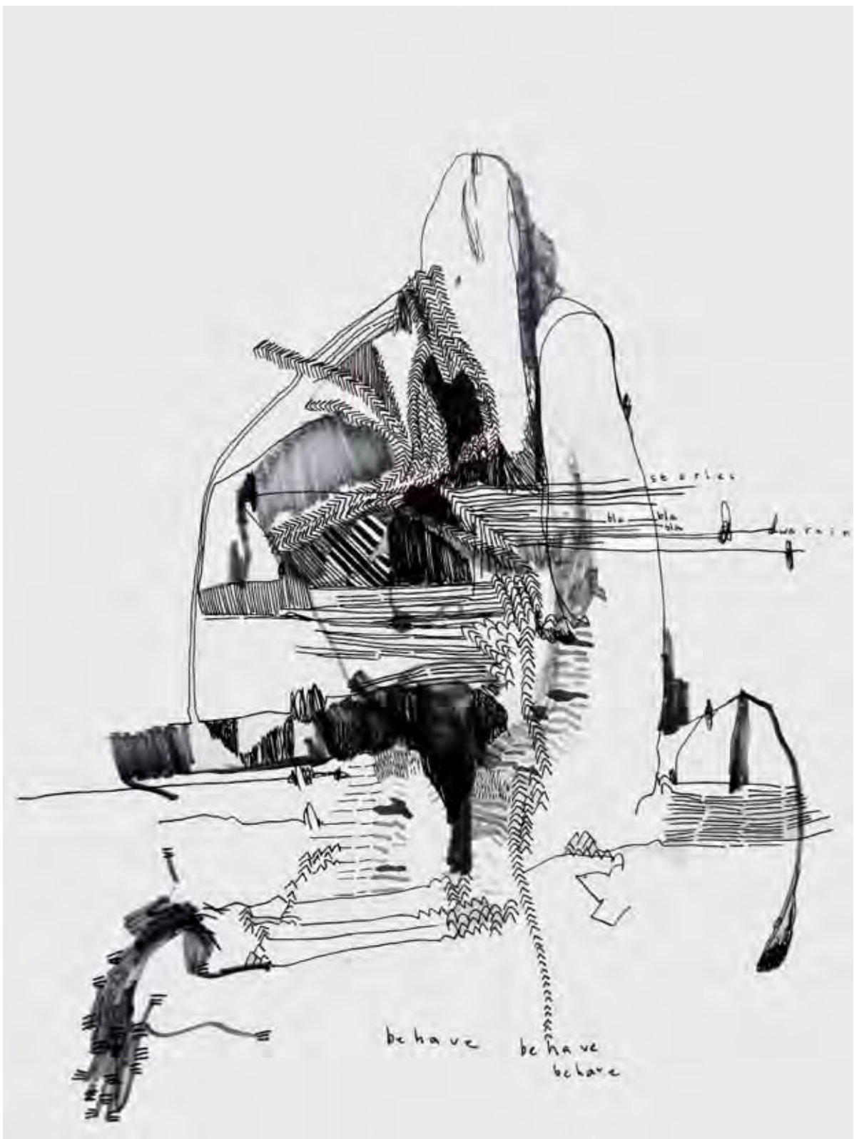
2. zonder titel , 23.03.2010