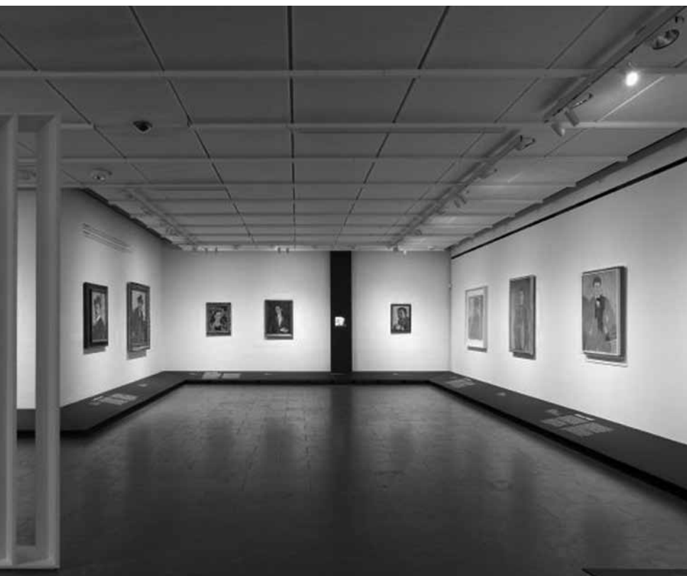
3b. Zaaloverzicht Self-Portrait .