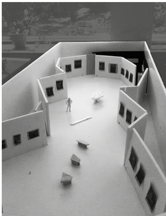
2a. Grondontwerp voor A Handshake , 2010, Anne Schnettler.