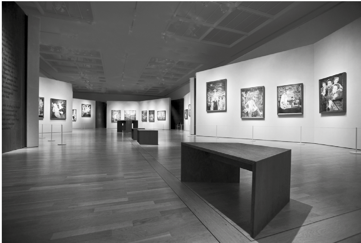
1a. Zaaloverzicht Bob Dylan – The Brazil Series , Statens Museum for Kunst, Kopenhagen, 2010. Het ontwerpen van onregelmatige wanden en materialen was hier van groot belang.