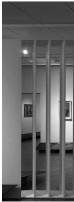
3a. Zaaloverzicht Self-Portrait (Louisiana Museum of Modern Art, Humlebæk, Denemarken, 2012-13).