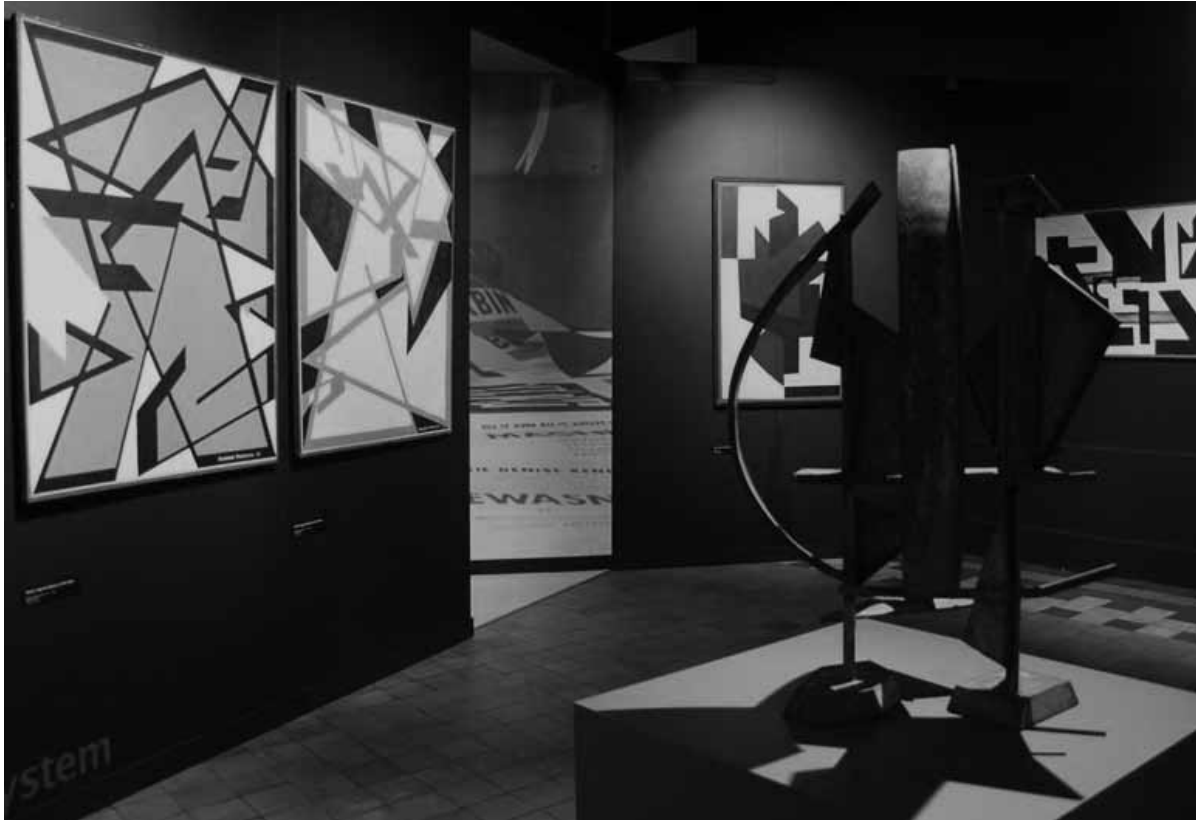
2c. Zaaloverzicht A Handshake . Het tentoonstellingsontwerp is geïnspireerd op de getoonde kunstwerken.