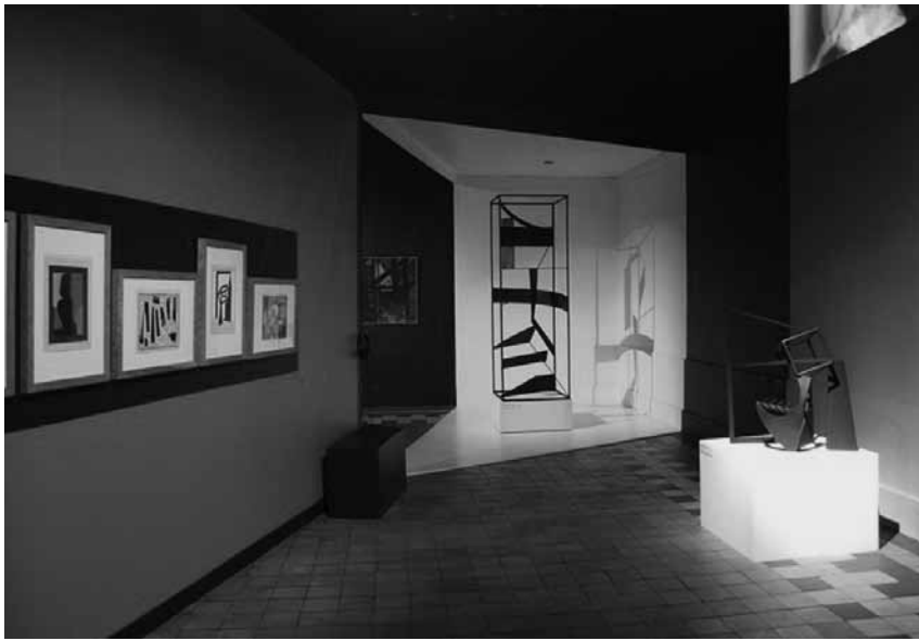
2b. Zaaloverzicht A Handshake (Fyns Kunstmuseum, Odense, 2010-2011).