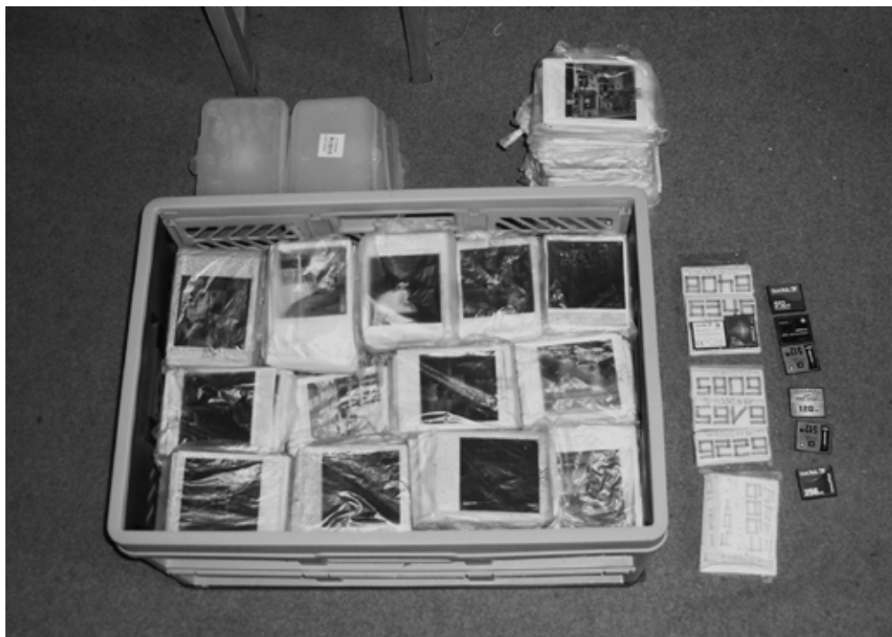
5. Een foto van het 'archief' van Ademeit, gemaakt door Ademeit zelf met digitale camera

vorm van ruwweg vijftien volgeschreven leporellokalenders. De foto's kunnen, op basis van de wijze waarop ze gecreëerd zijn, georganiseerd worden in verschillende lijnen werk die parallel aan elkaar lopen. Naast zijn fotodagboek, waarin hij binnen de beschermende muren van zijn appartement dagelijkse informatie omzette in nauwgezette stillevens, legde hij tijdens zwerftochten over straat alledaagse scènes vast (afb. 3). Deze scènes werden door Ademeits subjectieve perceptie overgeheveld naar een andere en nieuwe context van betekenis. In de spontaniteit en de trivialiteit van wat hij fotografeerde – achtertuinen, winkelwagens en geparkeerde auto's, slippers, bestek en een uitzicht uit een raam – doen de foto's denken aan straatfotografie. 7 Vanuit formeel oogpunt lijkt Ademeit wellicht in deze traditie te staan, maar de schijnbaar onbeduidende onderwerpen waren voor hem alles behalve futiel. Misschien zat er een bepaalde vorm van willekeurigheid en spontaniteit in zijn vroege foto's, toen hij nog niet met zijn onderzoek naar koude stralingen was begonnen, maar in zijn latere werk stond alles in het teken van dit streven. Ondanks de kunst- en ontwerppopleiding die Ademeit in zijn vroege jaren gevolgd had, positioneerde hij zich met zijn 'archief' niet als kunstenaar. 8 Veelzeg-