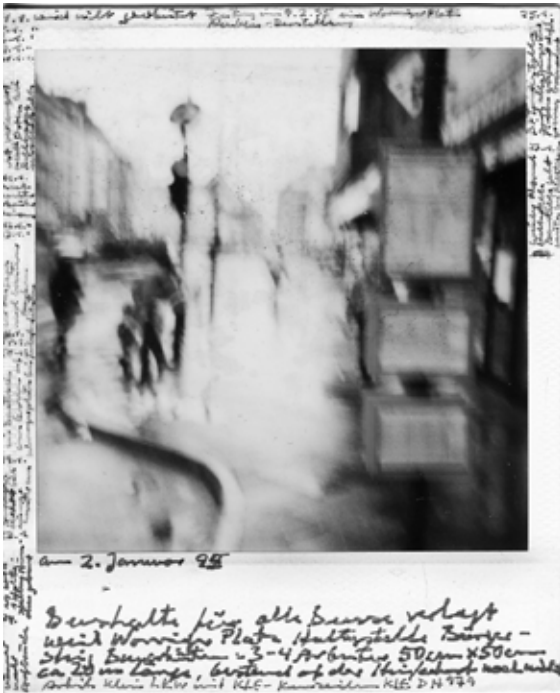
3. Straatbeeld: een bushalte in Düsseldorf, © Galerie Susanne Zander, Keulen

‘elektrische smog’, laserstralen en röntgenstraling, maar ook door de radiatie van verbrandingsinstallaties. Tegelijkertijd vond hij zo een overlevingsstrategie voor zichzelf. 5 In tegenstelling tot natuurlijke en kunstmatige stralingen (bijvoorbeeld de elektromagnetische golven die van hoogspanningslijnen, televisies of mobiele telefoons afkomen) kan er binnen de gangbare wetenschap geen bewijs worden gevonden dat koude stralingen als fysiek fenomeen enige betekenis hebben. Desalniettemin kan men deze stralingen opmerken wanneer ergens warmte wegtrekt, of simpelweg in de uitstraling van een koud object.