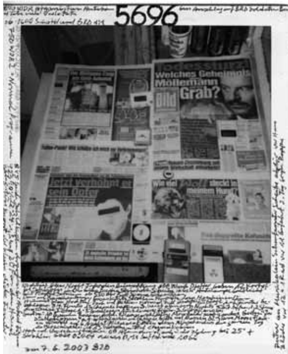
1. Een van Ademeits dagelijkse foto's binnenshuis

stelselmatige manier vast te leggen, niet alleen op straat, maar ook binnenshuis. Zo spreidde hij elke dag een exemplaar van de krant Bild uit op tafel en rangschikte hij er meetinstrumenten op. Beroemd-