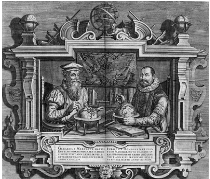
1 - Dubbelportret van Gerardus Mercator (1512-1594) en Jodocus Hondius (1563-1612), uit de atlas: Gerardi Mercatoris et J. Hondii Atlas ou representation du monde universal [...] , Amsterdam: Henry Hondius, 1633.

De geopolitieke tweedimensionale inkleuring van onze wereld die via de Mercatorkaart gemeengoed werd, is nu, eeuwen later, eigenlijk nog altijd de standaard. Een kaart is letterlijk een plattegrond, een platte grond. Mensen komen niet voor op de kaart, laat staan hun bewegingen, angsten, wensen en gevoelens. Intussen werd de representatie van de territoria steeds preciezer. Cartografie en geografie evolueerden tot harde wetenschappen. Een kaart werd een instrument van de rede, van de geopolitieke rede om precies