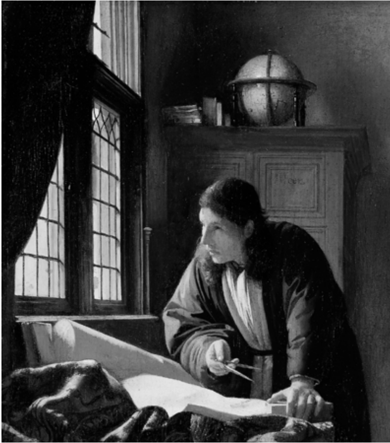
2 - Johannes Vermeer, De geograaf , 1669, olieverf op doek, 52 x 45 cm, Städel Museum, Frankfurt am Main.

Het tempo, ritme en de bewegingen van de mens in de ruimte en niet louter de stolling, de nederzetting zouden dan centraler komen te staan in de cartografie. Dus breng de routineuze en niet routineuze bewegingen, connecties, zigzagroutes, knooppunten, sporen en pleisterplaatsen van mensen in beeld. Maak kaarten die zich niet stuk staren op ruimtelijke afkomst, gestold onderscheid en afscheidingen, maar die juist de machtsrelaties, verbindingen, connecties en assemblages van mensen tonen. Met andere woorden: van 'roots' naar routes.