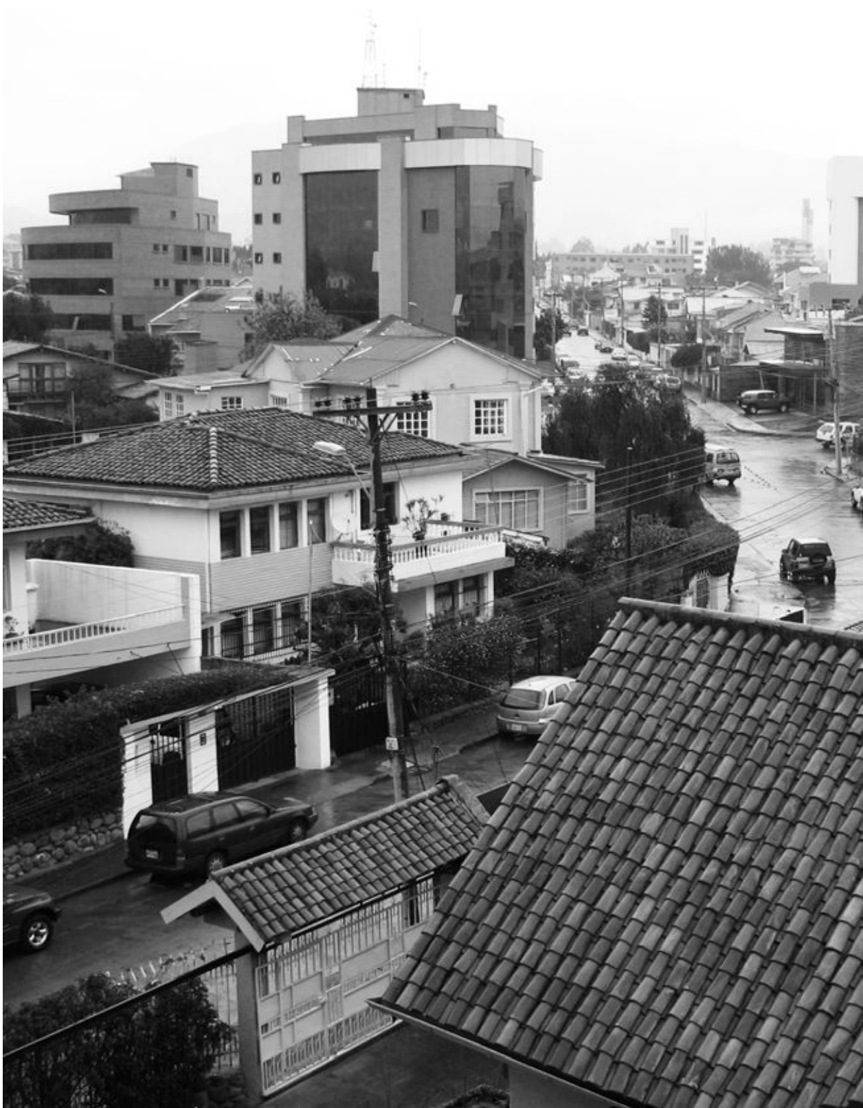
4. Commerciële hoogbouw in El Ejido, 2009. Op de voorgrond staan enkele villa's met pannendaken uit de periode van de Arquitectura Cuencana.