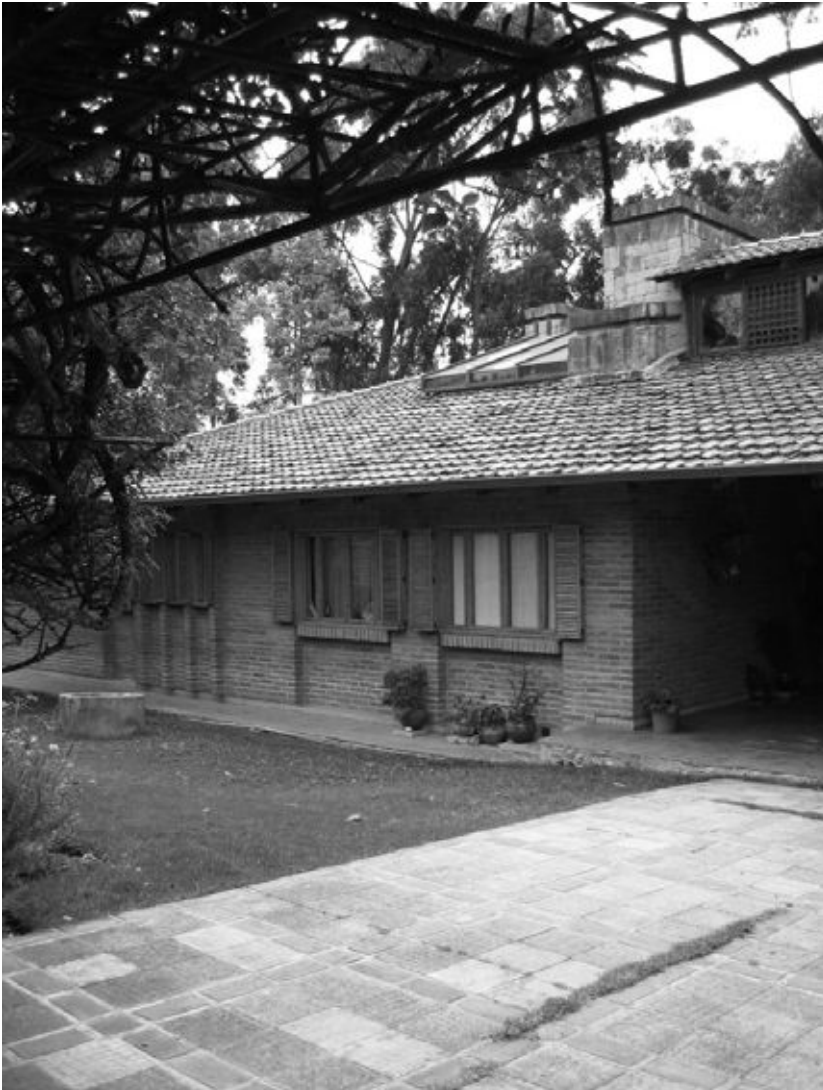
3. Villa's in de neo-ambachtelijke bouwtraditie van de Arquitectura Cuencana , passend in de ideologie van het kritisch-regionalisme.

zeventig en tachtig bebouwd met villa's, ontworpen door de eerste generaties lokaal opgeleide ingenieurs en architecten. 11