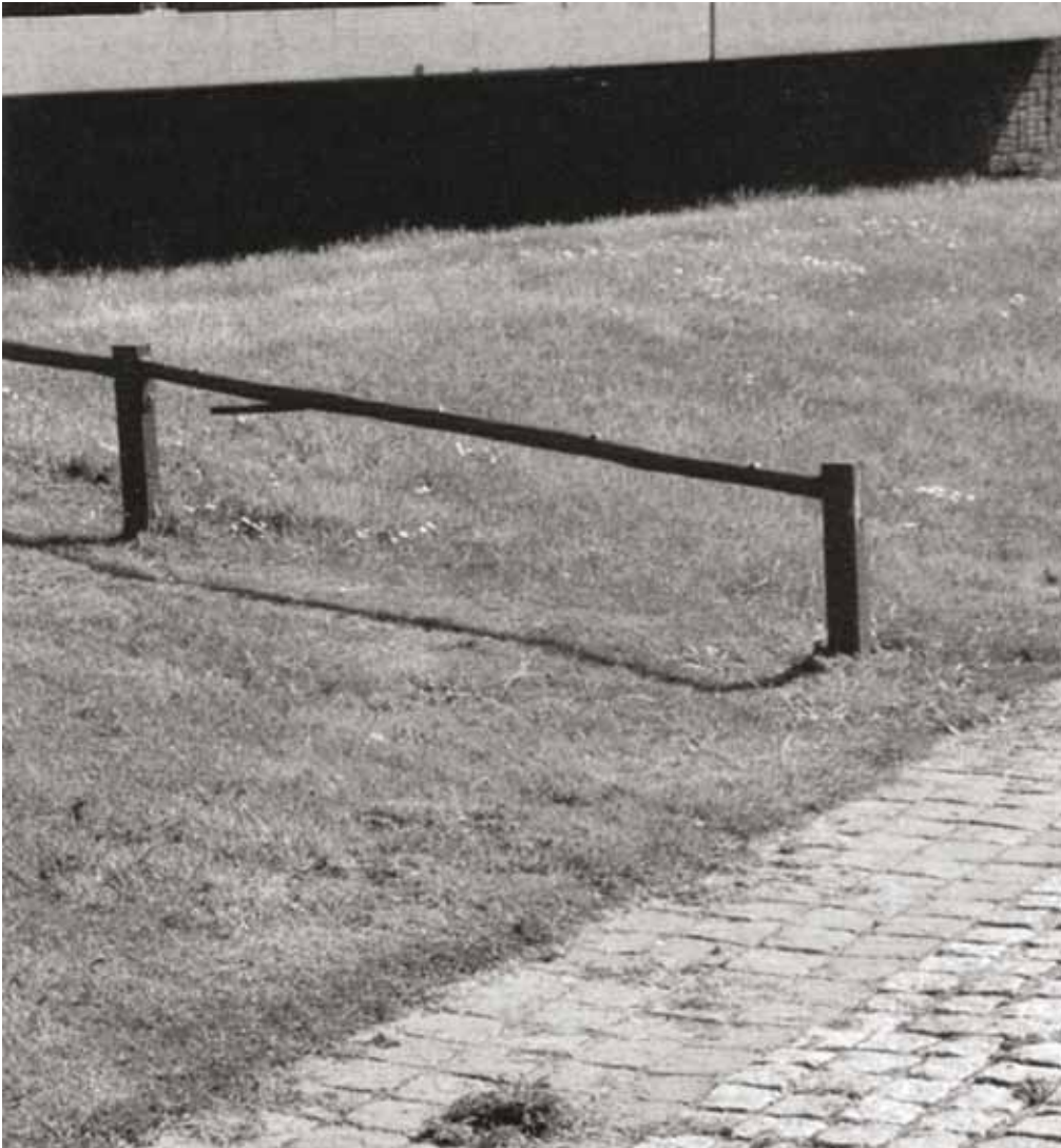
2. Een voorbeeld van een zachte rand. Het lage hekje geeft de grens aan tussen openbaar en collectief domein.

de gelegenheid biedt om de ander te ontmoeten. De behoefte om je grenzen aan te geven zal echter ook altijd bestaan en begint al bij de voordeur van je huis. Iedereen moet de vrijheid hebben om zichzelf terug te trekken, maar het plaatsen van een afgesloten begrenzing betekent ook dat je iemand anders jouw keuze oplegt. Wanneer vervolgens de grenzen van de privéruimte worden verlegd tot over de eigen kavel heen, is er sprake van een afsluiting van de openbare ruimte. De democratische ruimte waarin sociale contacten mogelijk worden gemaakt tussen elke burger, ongeacht zijn achtergrond, wordt dan ingeruild voor een afgeschermd omgeving waarin de beheerders bepalen