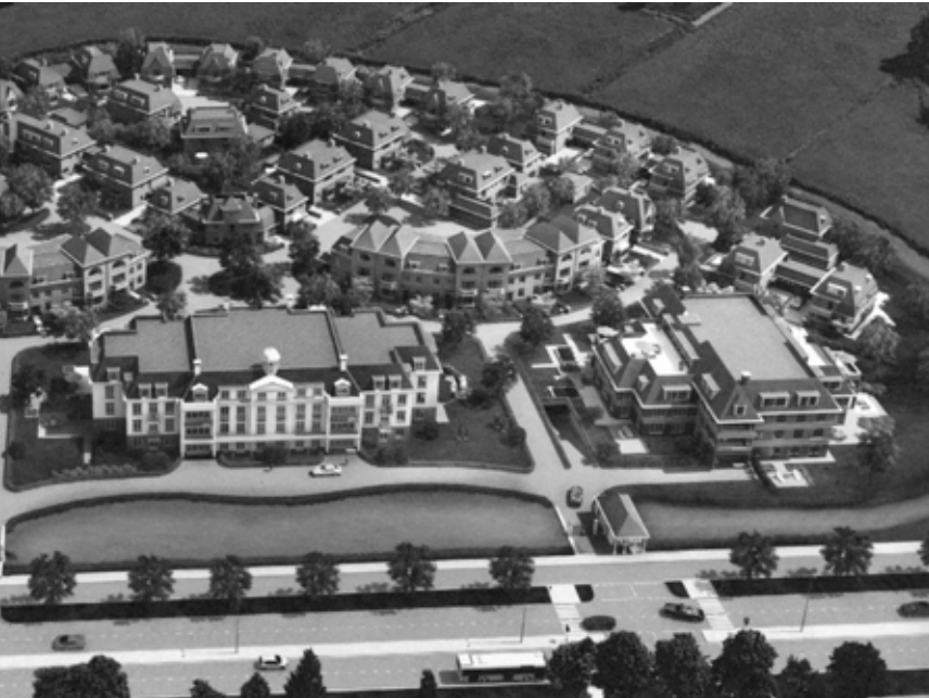
1. Omringd door de Biltse Grift is de toegang tot Park Bloeyendael nog slechts mogelijk via twee toegangspoorten die op de Utrechtseweg aansluiten. De portier bepaalt uiteindelijk wie op het terrein welkom is.

grachtenpanden en het raadhuis van Wassenaar. 9